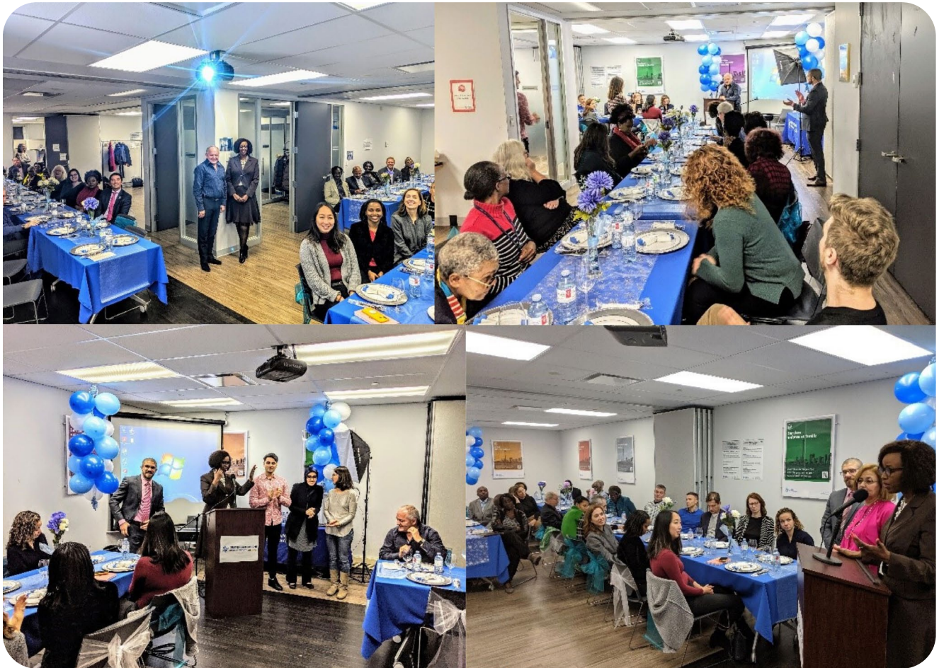
Brunch des partenaires (novembre 2019)