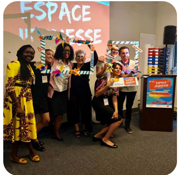
Lancement officiel de l'Espace Jeunesse en septembre 2019

Augmentation de la fréquentation des services de 50 à 75%, surtout grâce à la stabilisation des ressources humaines et de la promotion des services