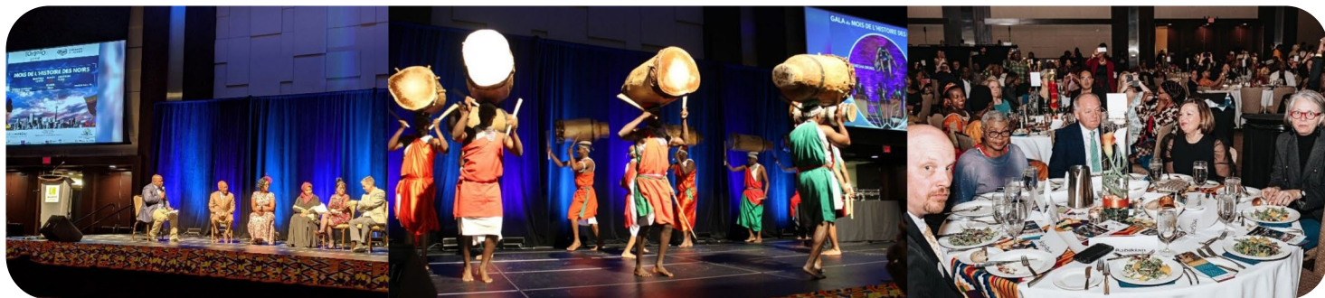
Panel de discussion sur l'inclusion

En tant qu'agent catalyseur, le CFGT appuie plusieurs initiatives d'engagement communautaire afin de contribuer au développement de plusieurs communautés, organismes et associations francophones. Encore une fois cette année, une trentaine d'organismes clés se sont réunis à l'occasion du Brunch des partenaires afin d'échanger sur les meilleures façons de desservir les francophones qui habitent dans la région du Grand Toronto. Enfin, nous avons fourni un appui moral et matériel à plus de vingt organismes et associations communautaires francophones du Grand Toronto.