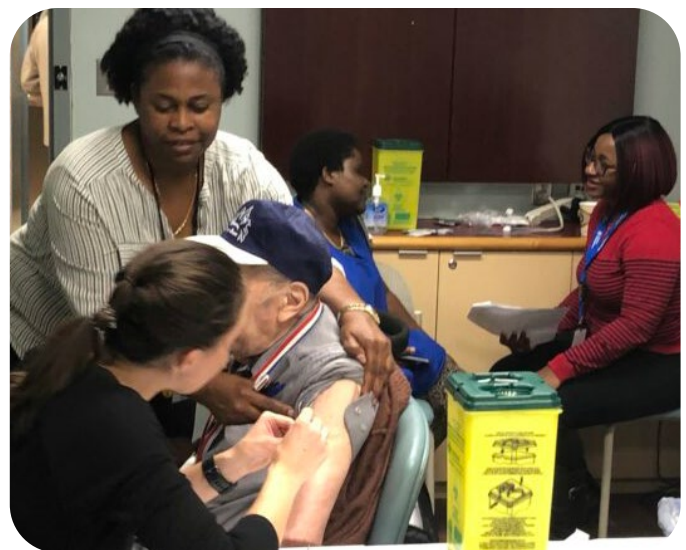
Séance de vaccination contre la grippe aux Centres d'Accueil Héritage (Place Saint-Laurent) par le personnel de la clinique médicale du CFGT