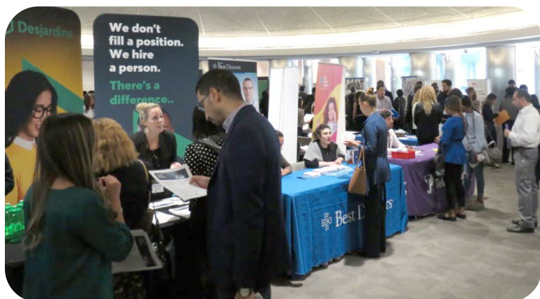
7 e édition de la foire d'emploi bilingue

Les Services d'emploi du Centre francophone du Grand Toronto (CFGT) offrent des services gratuits et privilégient une approche holistique pour venir en aide aux francophones de la région du Grand Toronto qui sont à la recherche d'un emploi ou qui souhaitent suivre une formation professionnelle. Les Services d'emploi appuient également les employeurs qui cherchent à embaucher des travailleurs bilingues et qualifiés.