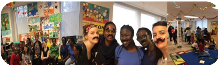
Activités organisées par l'équipe de la petite enfance