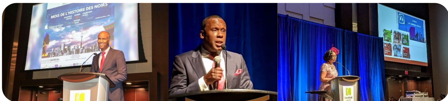
Ministre Ahmed Hussein

La 15 e édition de la Célébration du Mois de l'Histoire des Noirs a permis de réunir plus de 800 francophones de partout en région de même que plusieurs invités de marque, notamment le champion olympique Bruny Surin, le groupe Remesha Drums ainsi que plusieurs représentants élus de la région.