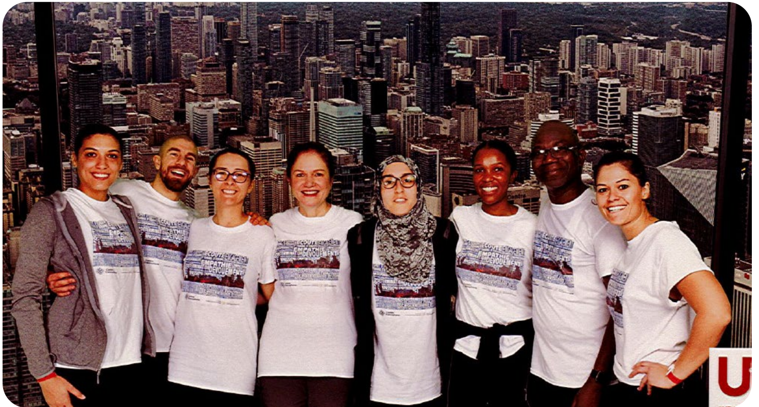
Équipe du CFGTT à la montée de la Tour CN organisée par Centraide en 2019

Encore cette année, le CFGTT était très bien représenté lors de la montée des 1776 marches de la Tour CN, une activité de levée de fonds organisée par Centraide. Grâce à de généreux dons, les employés du CFGTT ont versé 8130,60 $ à la campagne Centraide qui vient en aide aux communautés dans les régions de Peel, Toronto et York.