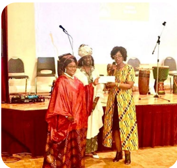
La directrice générale du CFGT en compagnie de la présidente de l'Association des Sénégalais de l'Ontario