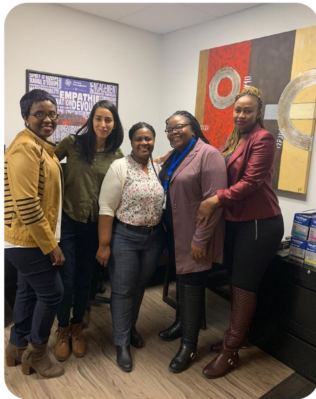
Équipe de La Passerelle-CFGT

En partenariat avec les conseils scolaires francophones Viamonde et MonAvenir, le Centre francophone du Grand Toronto (CFGT) offre un soutien clinique à des élèves de 6 à 17 ans qui nécessitent l'intervention de spécialistes. Grâce à La Passerelle – un centre de traitement de jour situé à même leur école élémentaire ou secondaire – les élèves peuvent accéder aux services dont ils ont besoin tout en poursuivant leurs études.