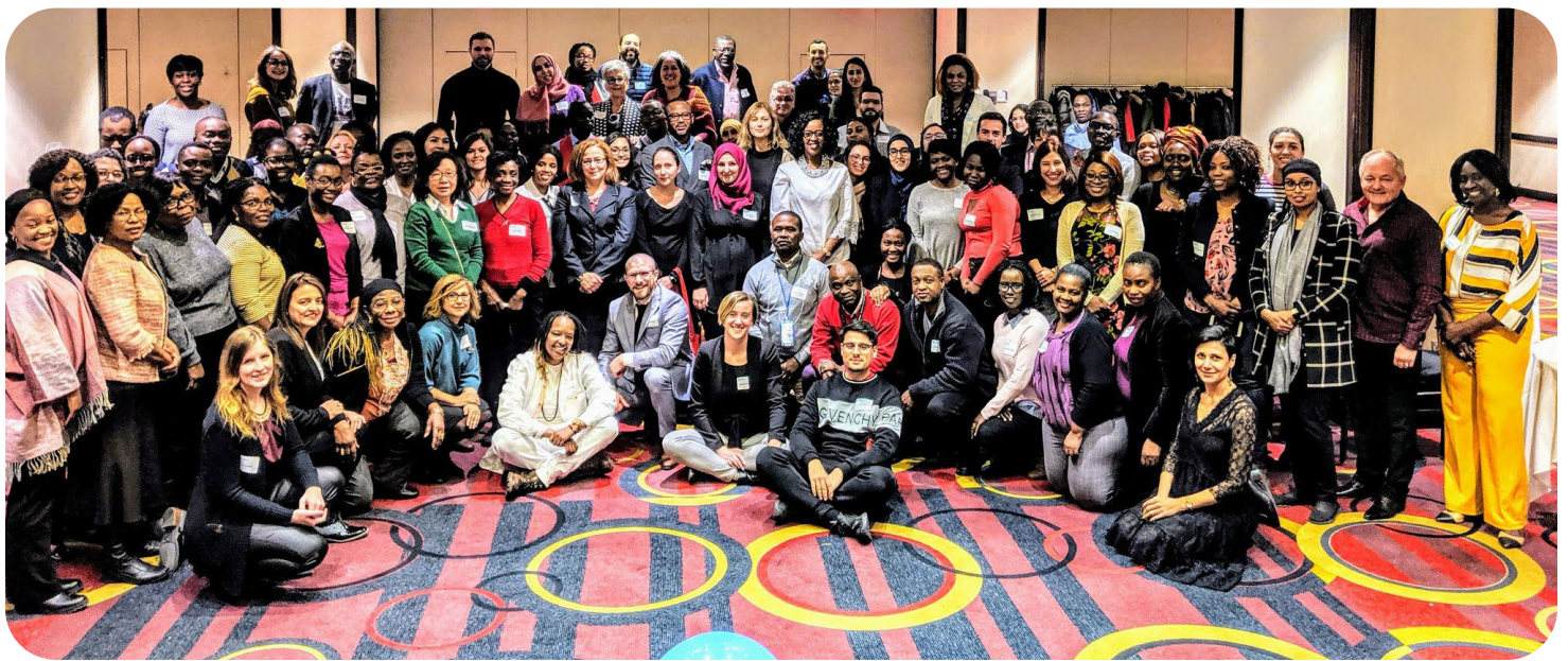
Photo des employés du CFGT lors de la Retraite de décembre 2019

Ces initiatives, et bien d'autres encore, constituent une fondation solide sur laquelle reposera l'élaboration et la mise en œuvre de notre nouveau plan stratégique 2020-2025 pour assurer un avenir encore meilleur à la francophonie torontoise d'aujourd'hui et à celle de demain.